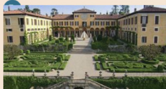
LIONARD LUXURY | 10 maggio 2017 Con la flax tax per i super ricchi più richieste di immobili di lusso

Villa Buonaccordo di Portofino è stata venduta a un imprenditore cinese per una cifra record compresa tra i 30 e i 35 milioni di euro. La posizione unica che sovrasta il golfo del Tigullio e il colore giallo rendono la villa facilmente riconoscibile in molte foto che immortalano il prestigioso borgo ligure.