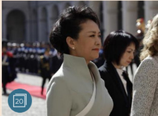
STILI-TENDENZE | 22 marzo 2019 L'«occidentale attitude» della signora Xi nelle visite di Stato