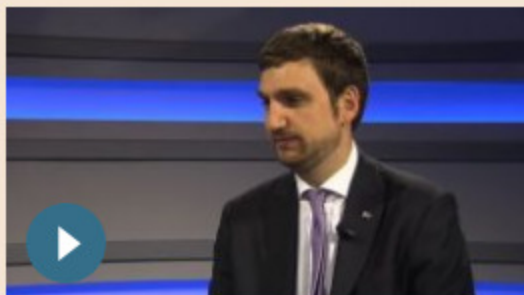
POLITICA | 22 marzo 2019 Brexit, Ungaro: Italia poteva fare di più ma siamo pronti