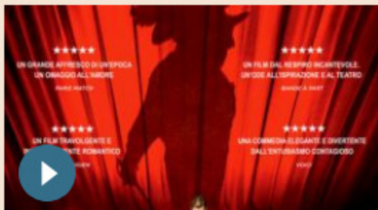
CINEMA | 22 marzo 2019 Cyrano Mon Amour