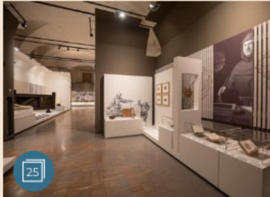
ARTI VISIVE | 22 marzo 2019 Leonardo in mostra alle Scuderie del Quirinale