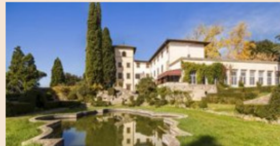
DIMORE STORICHE | 20 febbraio 2018 Villa Bibbiani diventa americana

a comprare siano soprattutto gli stranieri. È ormai infatti finita da tempo l'epoca in cui le proprietà passavano di mano tra italiani senza che nessuno dei non addetti ai lavori ne fosse a conoscenza.