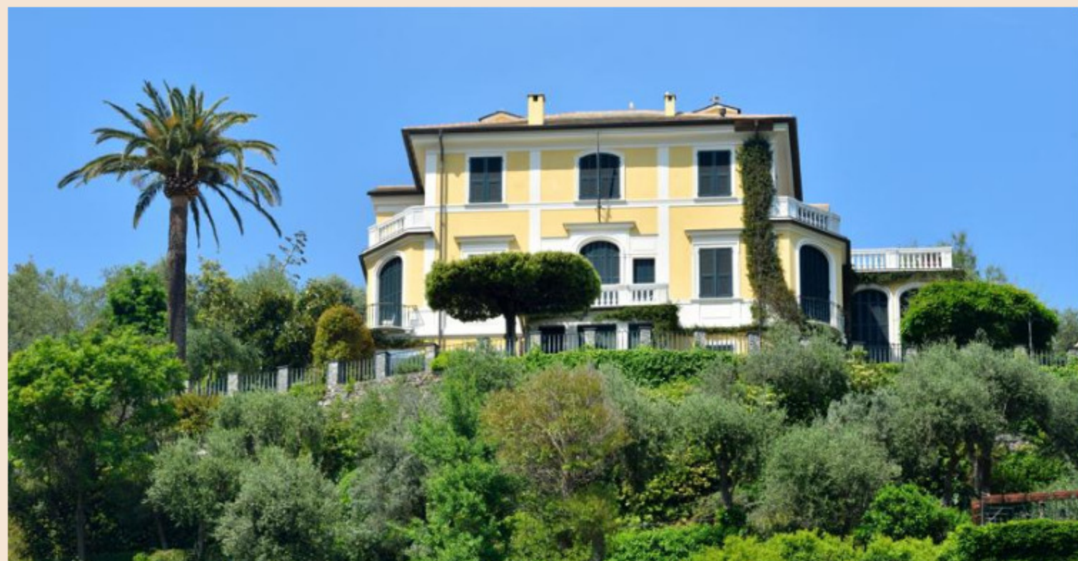
Portofino, villa Buonaccordo è stata venduta per circa 35 milioni a un imprenditore cinese