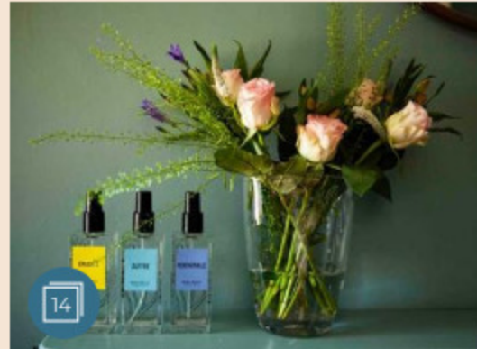
BEAUTY-BENESSERE | 22 marzo 2019 Oli essenziali e fragranze naturali: così la casa profuma di buono