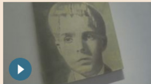
CULTURA | 22 marzo 2019 La pittura nel territorio dell'indicabile: Luc Tuymans a Venezia