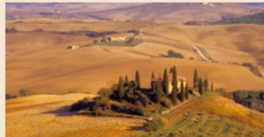
GATE-AWAY.COM | 07 febbraio 2019 Aumentano gli stranieri che cercano casa in Italia, la Toscana resta regina

Protagonisti sul mercato restano anche i "magnati" russi, che hanno comprato molto soprattutto sulle coste, ma anche all'interno della Toscana, sostituendosi, almeno in parte, alla storica clientela inglese. Un'altra dimora storica di Portofino, Villa Altachiarà che fu della contessa Francesca Vacca Agusta nel 2015 fu comprata all'asta da un acquirente russo per 25 milioni. A vendere in ogni caso sono gli italiani, mentre difficilmente gli stranieri "si pentono" degli affari conclusi.