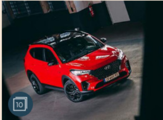
AUTO | 22 marzo 2019 Nuovo Hyundai Tucson N Line