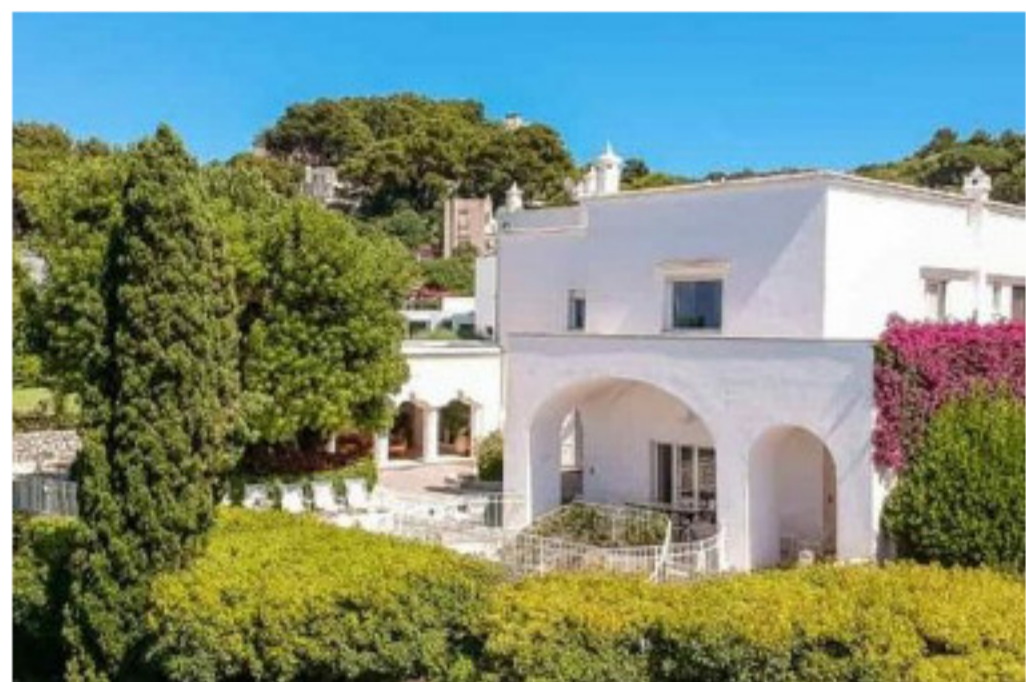
Capri si vende la villa dove visse Totò vista mozzafiato sul mare, Napoli e Ischia

A Capri si vende la villa dove visse Totò, costruita da Carlo Ludovico Bragaglia, è immersa con vista panoramica a 360 gradi