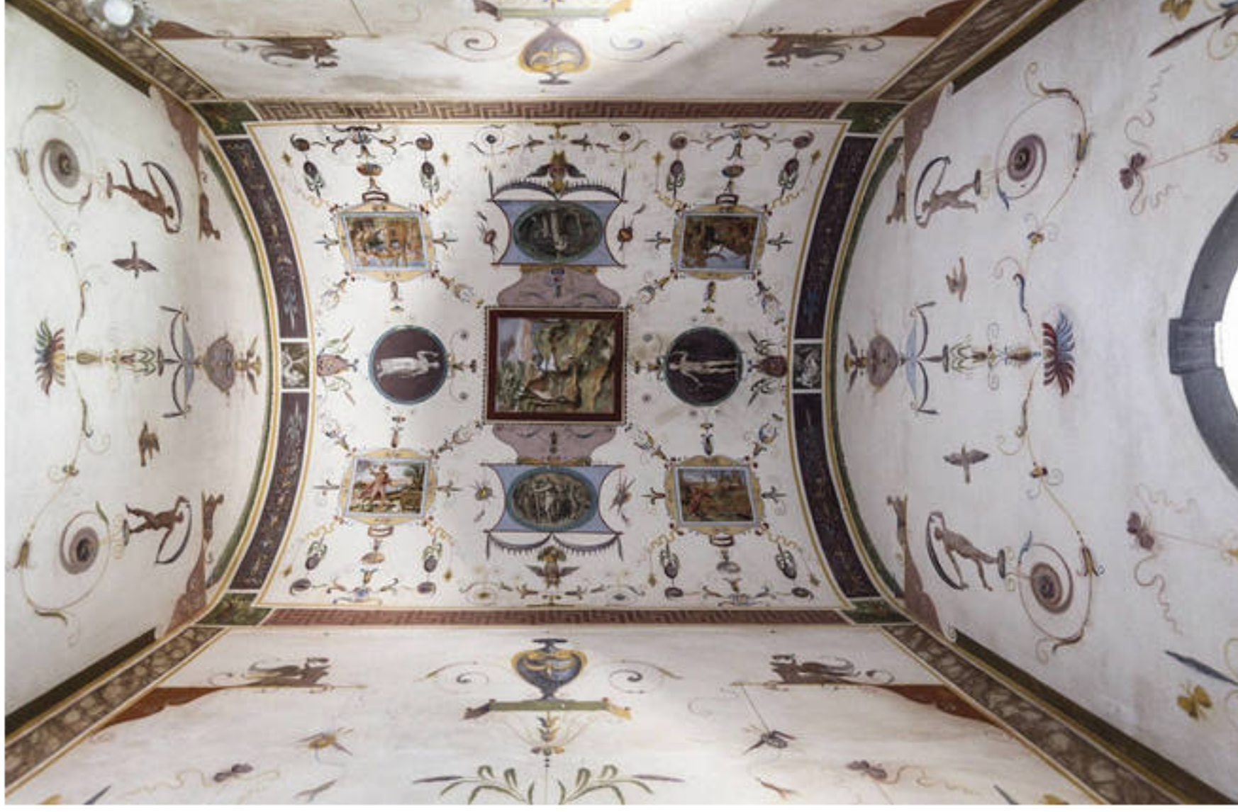
El castillo mantiene en perfecto estado frescos y ornamentaciones diseñados por Brunelleschi hace 600 años.

La confirmación de que el castillo fue diseñado por Brunelleschi es fruto de la investigación del profesor Massimo Ricci , uno de los mayores expertos del mundo en la obra de este maestro florentino que, además de la cúpula de la catedral de Florencia, tiene entre otras obras destacadas una buena parte de los monumentos que han convertido a esta ciudad en la cuna del Renacimiento, como el Hospital de los Inocentes o la Basílica de San Lorenzo, además de esculturas y obras de orfebrería.