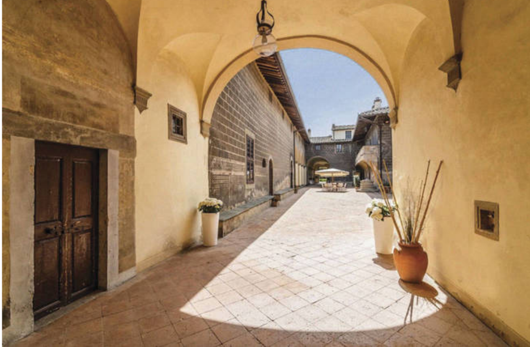
La fortificación principal consta de un patio exterior y otro interior y un maravilloso jardín.

Solo Filippo Brunelleschi podría hacer algo así en aquellos años. El creador de la cúpula de Santa María del Fiore –el Duomo de Florencia–, el mejor arquitecto de la época –nació en 1377 y murió en 1446–, ideó este castillo situado en el corazón de la Toscana italiana, aupado en una colina a apenas 45 kilómetros de Florencia, 50 de Siena y 80 de Pisa o Bolonia, rodeado de tierras agrícolas y bosque, que sale ahora a la venta. 600 años de historia para los que no hay precio fijo. “Una de las más prestigiosas propiedades nunca puestas en el mercado”, según Dimitri Corti, presidente de Lionard Luxury Real Estate, la agencia especializada en villas de lujo italianas que lo publicita y que remite a una “negociación privada” el precio final.