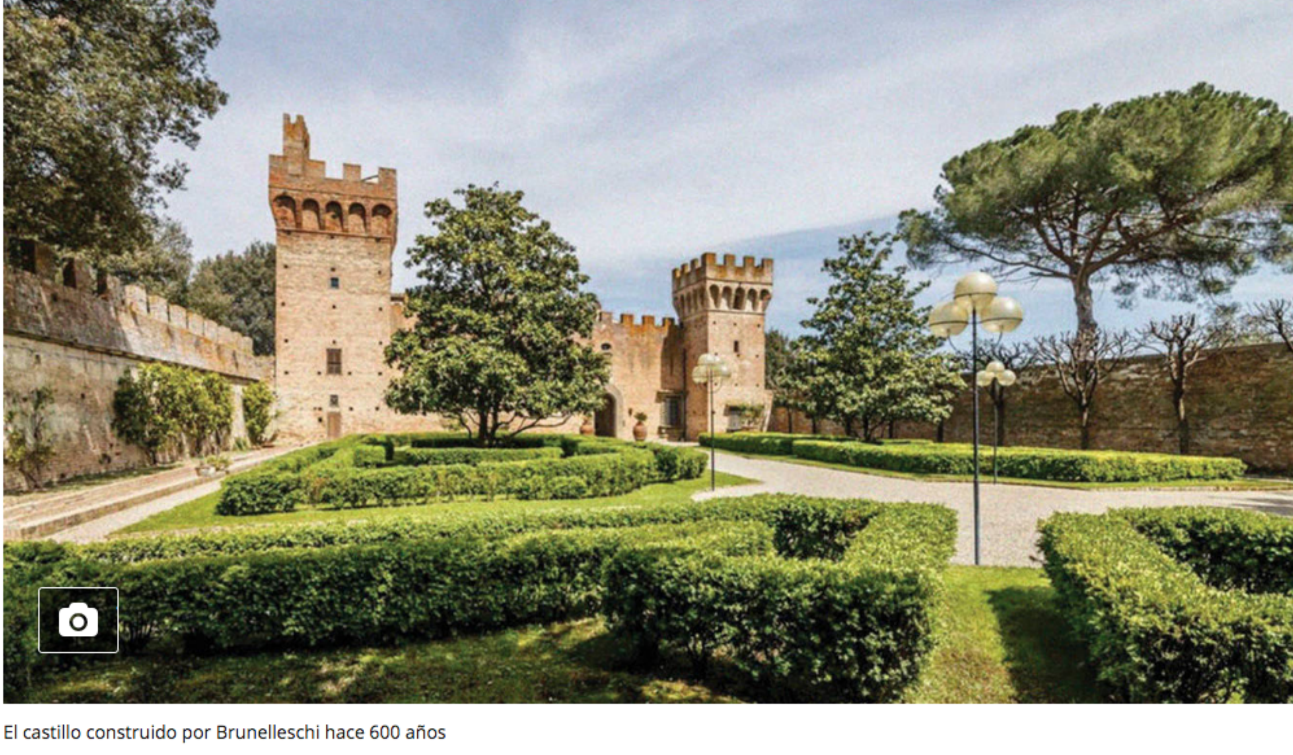
El castillo construido por Brunelleschi hace 600 años

Construido por Brunelleschi, es considerado uno de los más bellos de su zona. Su historia habla de majestuosidad y poder como hospedaje de reyes y papas. Ahora sale a la venta